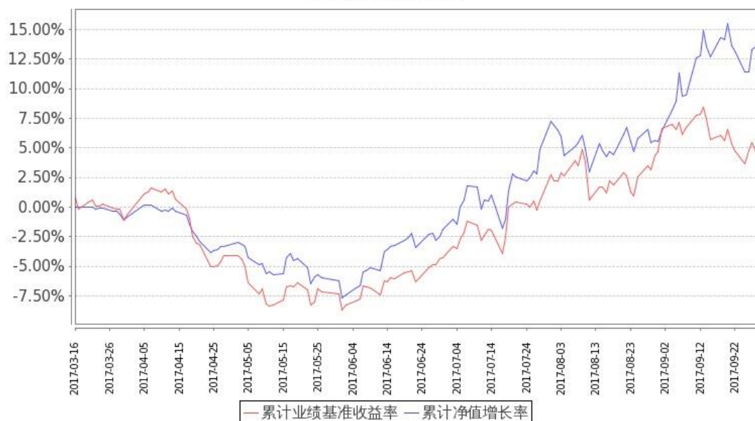
图 2：嘉实新能源新材料股票 C 基金累计份额净值增长率与同期业绩比较基准收益率的历史走势对比图